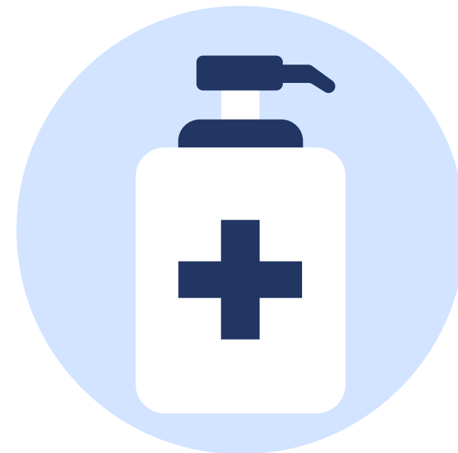
Дозатори для антисептиків