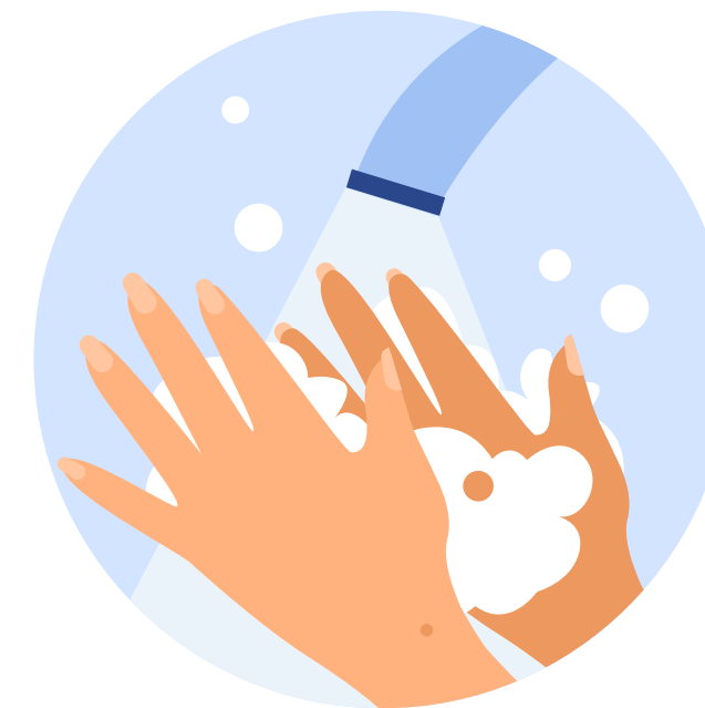
Миття рук з милом перед уроками

Керівник та засновник закладу освіти відповідає за те, щоб у медичному пункті були необхідні засоби та обладнання: безконтактні термометри, дезінфектори, антисептики для рук, засоби особистої гігієни та індивідуального захисту.